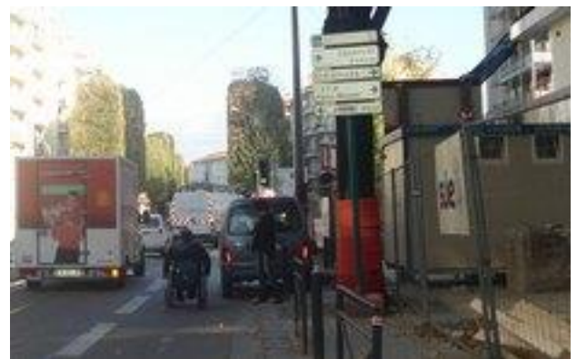
Passage d'une personne handicapée "carrément sur la rue" devant la construction en cours du Central Plaza Boulevard Albert 1 er de Belgique.

- La propreté : les lieux publics ne sont pas une déchetterie de proximité.