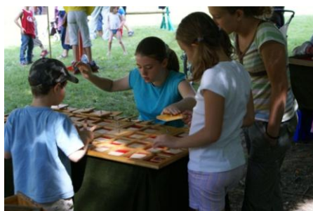
Au Parc Paul Mistral