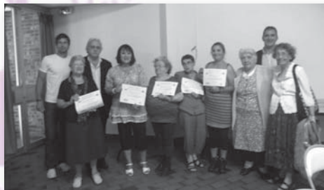
Remise des prix

• Projet intergénérationnel "Jardin'Âges" avec l'Ecole PAINLEVE : plantations dans le jardin de l'école, rencontres éducatives, goûters partagés, entretien du jardin par les séniors durant les congés d'été. L'Ecole a remporté le 2 ème prix du Concours de l'Education Nationale.