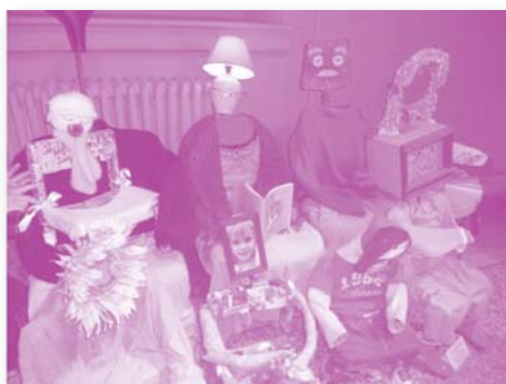
La Famille Chaises

Nous avons aussi organisé plusieurs sorties en car à la journée ; les Fêtes de Carnaval, Fête des Mères ; et 3 séjours personnes âgées sur le domaine de MASSACAN près de Toulon.